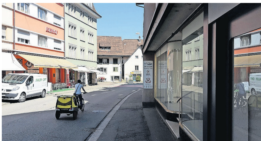
An der Solothurnerstrasse wird das «Gestaltungskonzept Innenstadt» umgesetzt. Die Umbauarbeiten dauern voraussichtlich bis Mitte Dezember 2015.

Die Oberfläche wird von Fassade zu Fassade neu erstellt, die Kanalisation sowie ein Teil der bestehenden Werkleitungen (Strom, Gas, Telefonleitungen und Fernsehkanäle) werden erneuert. Dabei wird das Gestaltungskonzept Innenstadt umgesetzt, welches mehr Platz für den Langsamverkehr vorsieht und das Trottoir verbreitert. Die Querungsmöglichkeiten werden zusätzlich vereinfacht mit neuen, schräg gestellten Randabschlüssen.